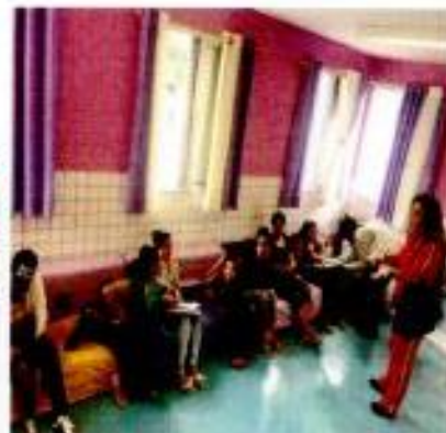
Reunião de pais