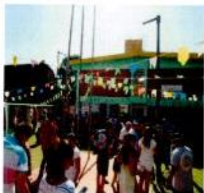
Festa com as famílias

Neste segundo trimestre realizamos a Festa das tradições onde contamos com a presença significativa das crianças seus familiares e comunidade. O evento foi muito importante para estreitarmos os laços entre o CEI e as famílias e mais uma oportunidade da comunidade estar mais inseridas nas atividades do CEI.