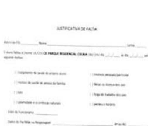
Justificativa de faltas

Cancelar a matrícula quando o não comparecimento da criança ao CEI por um período de 15 dias consecutivos não justificados ou conforme o previsto em Portaria Especifica.