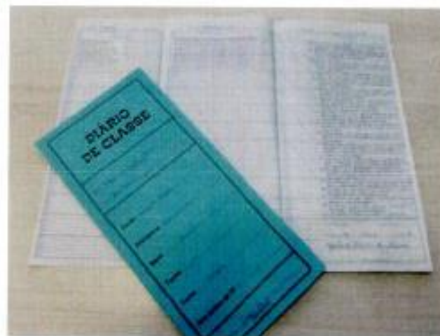
Diário de classe