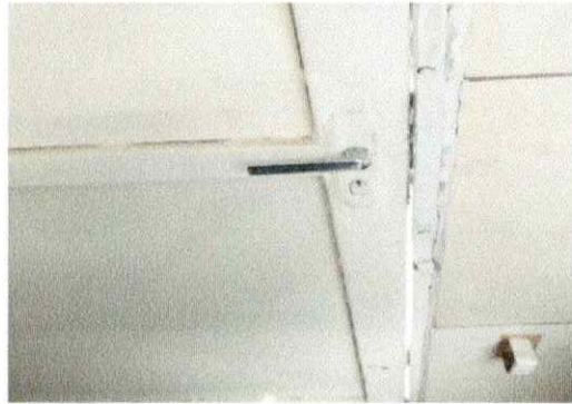
Manutenção fechadura e batente cozinha