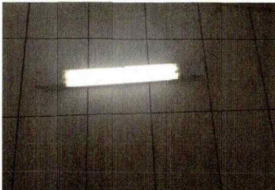
Troca lâmpadas de LED banheiro sala 03