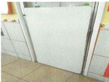
Pintura porta da cozinha