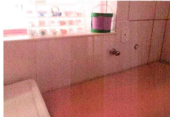
Troca azulejos quebrados sala 01