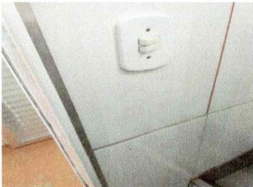
Troca de azulejo quebrado sala 04