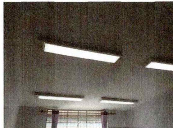
Troca de lâmpadas de LED refeitório pq.