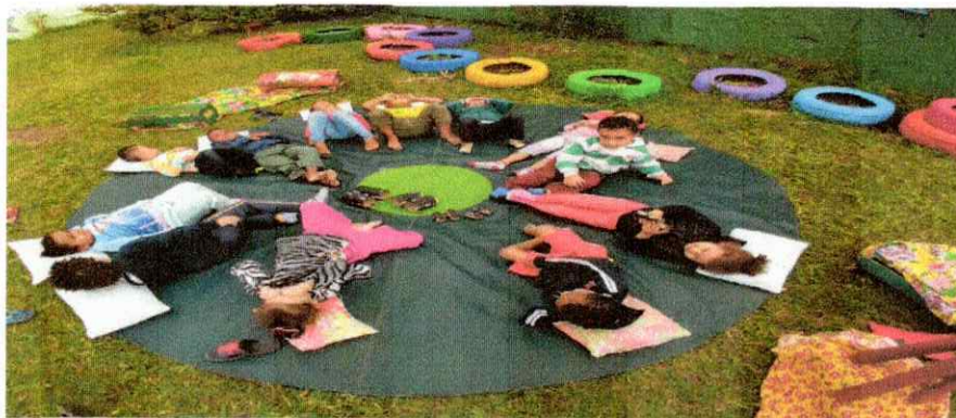
Atividade MI B