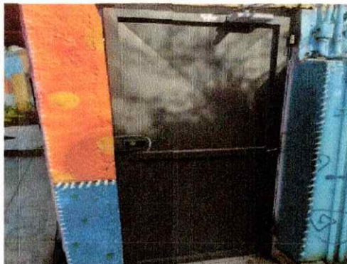
Troca portãozinho entrada