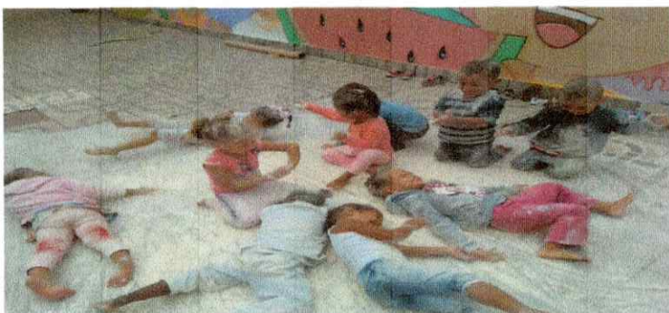
Atividade MI C

São realizados registros pelas professoras das atividades desenvolvidas, contendo estratégias e observação, que serão utilizados para a avaliação individual do aluno de acordo com a orientação normativa nº 01/2013.