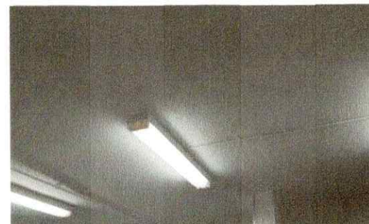
Pintura e manutenção teto da cozinha