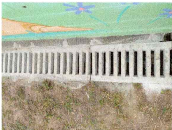
Instalação 5 metros grelhas no parque