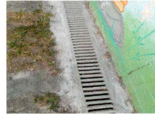
Instalação de grelha de cimento parque