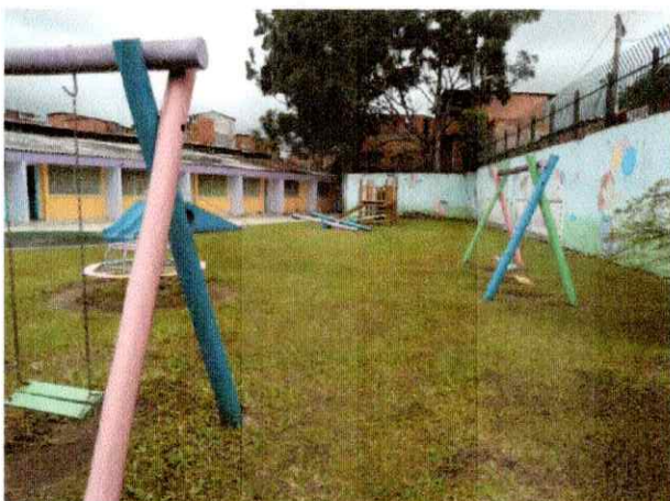
Corte de Grama dos parques