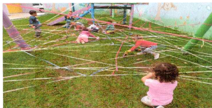
Atividade BII A/B