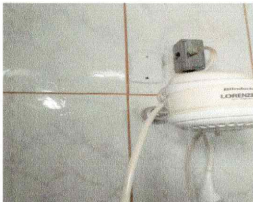
Reparo elétrica salas 01,05,04 e 06