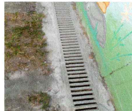
Troca 5 metros de grela parque