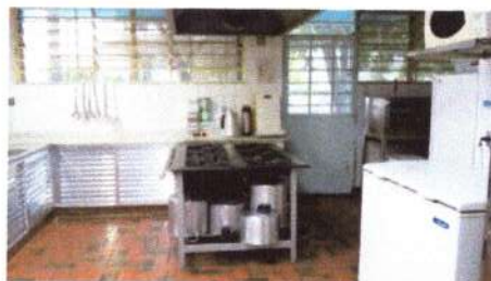
Ambientes conservados e limpos

Nos meses de Abril a Junho houve a aquisição de brinquedos e tapetes pedagógicos, como mostra as fotos abaixo: