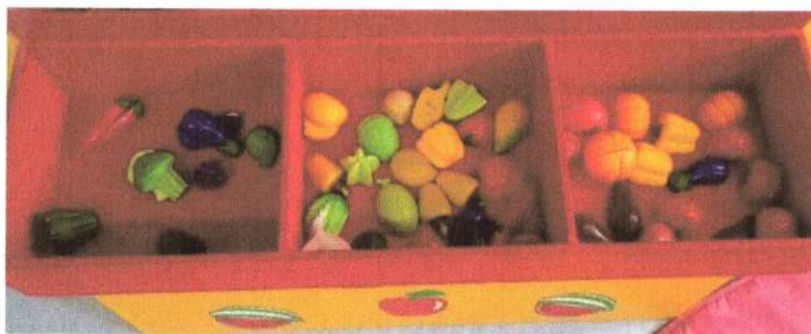
Kit de mini carrinho