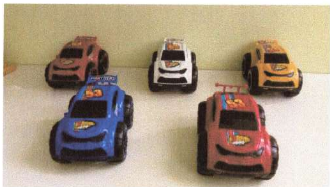
Kit de mini carrinho