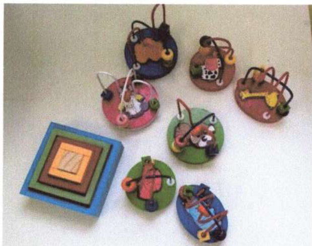
Cubo de encaixe e mini aramado para brinquedoteca