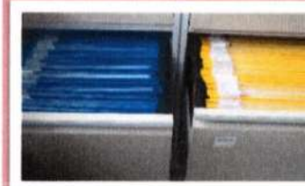
Prontuários das crianças