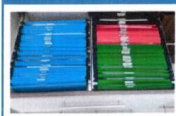
Documentos da Unidade